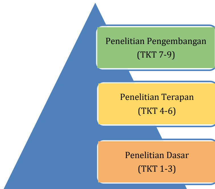
Gambar (1): TKT Riset Program MoRA the AIR Funds