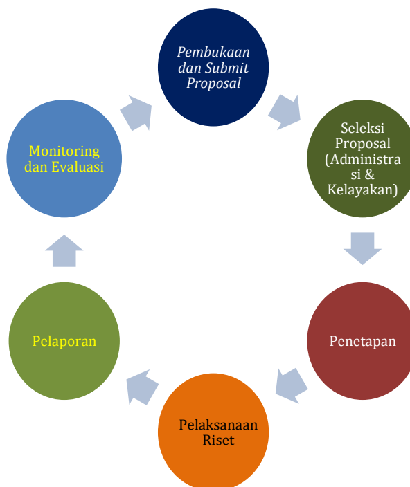
Gambar (2): Skema alur pelaksanaan program MoRA the AIR Funds

Tahapan pelaksanaan Program MoRA the AIR Funds dilakukan dengan mekanisme sebagaimana gambar di bawah ini: